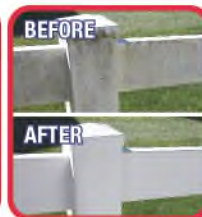
Real results from real customers / Resultados reales de clientes reales